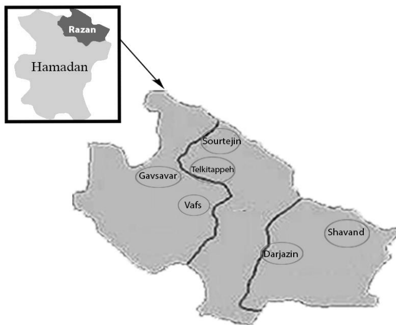
شکل ۱. نقشه جغرافیایی مناطق مورد مطالعه برای شناسایی ژنوتیپ‌های برتر گردو در شمال استان همدان Figure 1. Geographical map of the studied sites for identification of walnut superior genotypes in north of Hamedan province

۲۷۰ ژنوتیپ بالغ گردو آغاز گردید. از جمله صفات حائز اهمیت در پیش انتخاب ژنوتیپ‌های مورد مطالعه، دیر برگ‌دهی، مقاومت به سرما، عدم آلودگی به آفات و امراض، عملکرد بالا، درصد مغز بالا، مغز روشن، سهولت جدا شدن مغز از پوست سخت چوبی و نازک بودن پوست دانه بود. در ادامه پس از پلاک کوبی، ژنوتیپ‌ها بر اساس دو توصیف‌نامه ارزیابی گردو IPGRI و UPOV که به ترتیب توسط مؤسسه بین‌المللی منابع ژنتیکی گیاهی و اتحادیه بین‌المللی حمایت از ارقام جدید گیاهی تهیه شده است، مورد مطالعه و بررسی قرار گرفتند (Vezaei et al. , 2003). پس از ارزیابی‌های مورفولوژیک و فنولوژیک ۲۷۰ ژنوتیپ مورد مطالعه، تعداد ۸۴ ژنوتیپ جهت ارزیابی‌های بعدی انتخاب گردید.