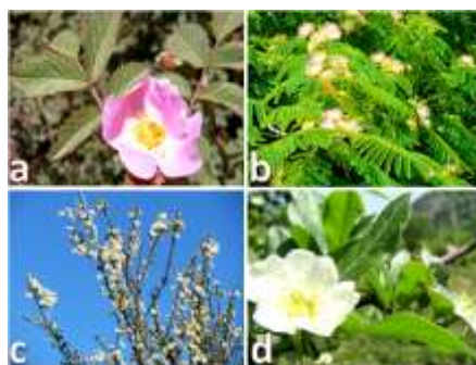
شکل ۳. منظر بهاره برخی از گونه های درختی در منطقه مورد بررسی (a) نسترن وحشی، Rosa canina L. S. Str.، b: شب خسب Albizia julibrissin Durazz، c: ازگیل جنگلی Mespilus germanica L. و d: آلوچه جنگلی Prunus spinosa .) Figure 3. Spring view of some tree species in the studied area (a: Rosa canina L. S. Str.; b: Albizia julibrissin Durazz.; c: Mespilus germanica L.; d: Prunus spinosa ).