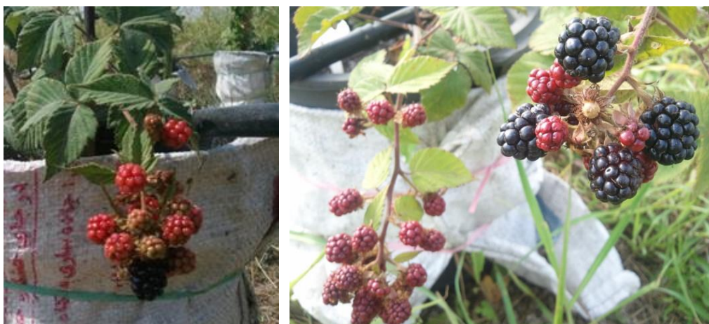
شکل ۲. تفاوت رنگ میوه پیش از رسیدن در دو نمونه تمشک سیاه بی‌خار شامل نمونه رامسر cvTLRahmadi5 (سمت راست) و نمونه ساری ۱۰ (سمت چپ)

در این بررسی برای ارزیابی فاصله همانندی‌ها و تفاوت‌های نژادگان‌های تمشک بی‌خار و همچنین گروه‌بندی آن‌ها از تجزیه خوشه‌ای (شکل ۳) استفاده شد. بنابر نتایج نمونه‌ها بر مبنای تفاوت معنی‌دار طول گل، نسبت میزان قند به اسید و شمار و وزن بذر نمونه‌های درون آن‌ها در دو دسته مجزا با ۱۰۰ درصد تفاوت قرار گرفتند، که دسته اول با میزان تفاوت حدود ۳۸ درصد به دو گروه و آن‌ها هم در فاصله کمتر از ۲۰ درصد به زیرگروه تقسیم شدند. دسته دوم شامل ۷ نژادگان بود که با میزان حدود ۱۰ درصد تفاوت به دو گروه و زیرگروه کوچک‌تر تقسیم شد.