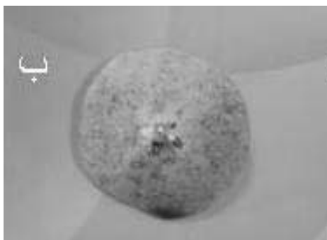
شکل ۱- مقایسه آزمون نشاسته میوه سیب رقم رد دلشس (الف) و گلابی رقم درگزی (ب)